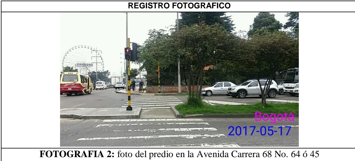
FOTOGRAFIA 2: foto del predio en la Avenida Carrera 68 No. 64 ó 45